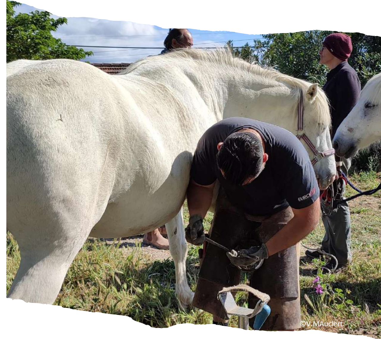
Mai 2023: Soin des chevaux du marais