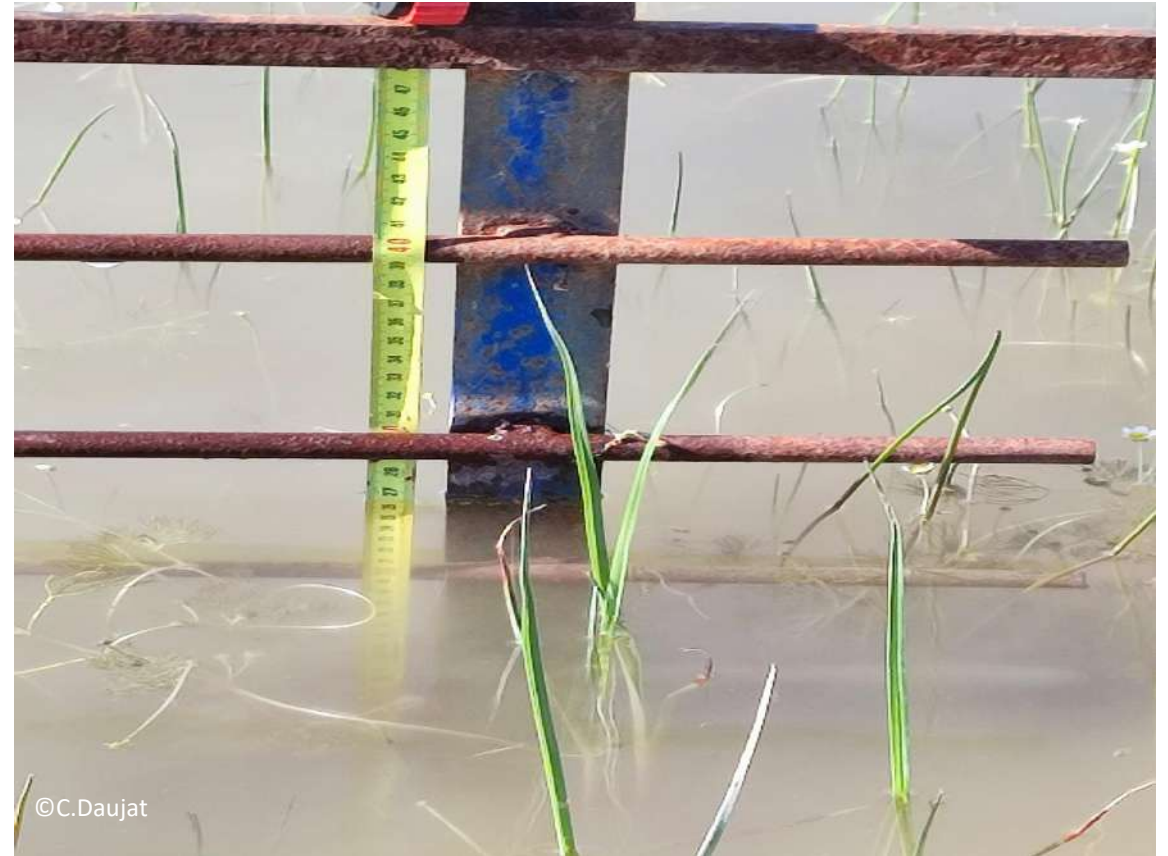
Niveau d'eau: env 27 cm