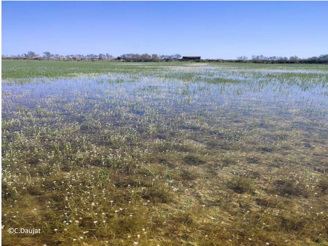
Avril 2023: Petite baisse (Scirpes maritimes et renoncules)