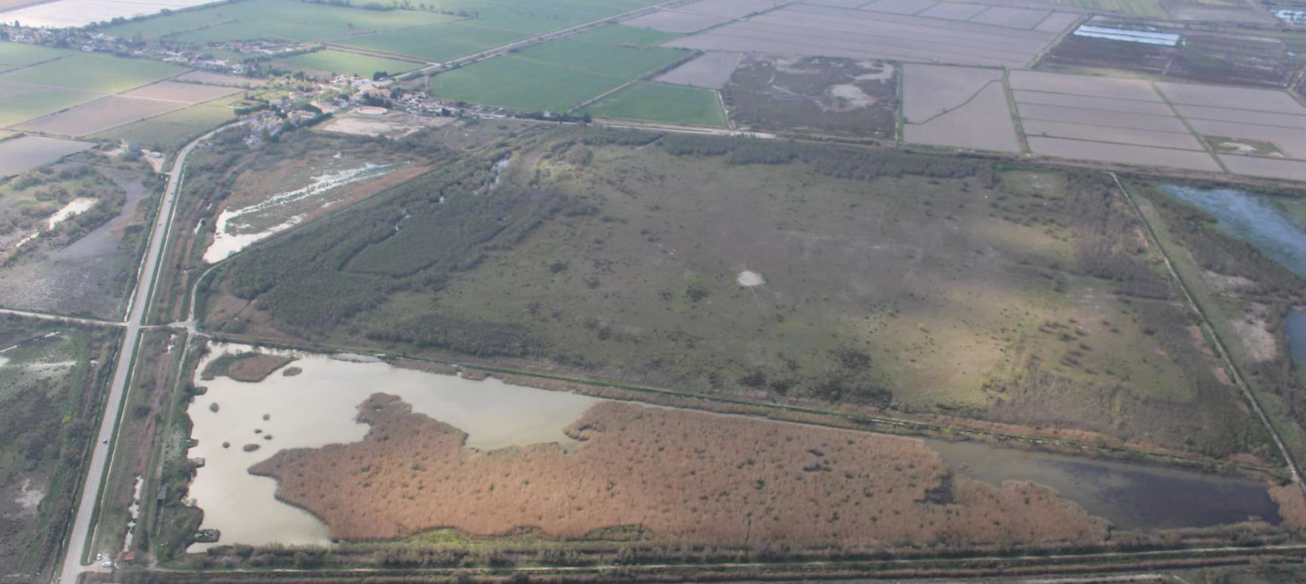
Avril 2023: Pesquier, Palunette, Les Enganes