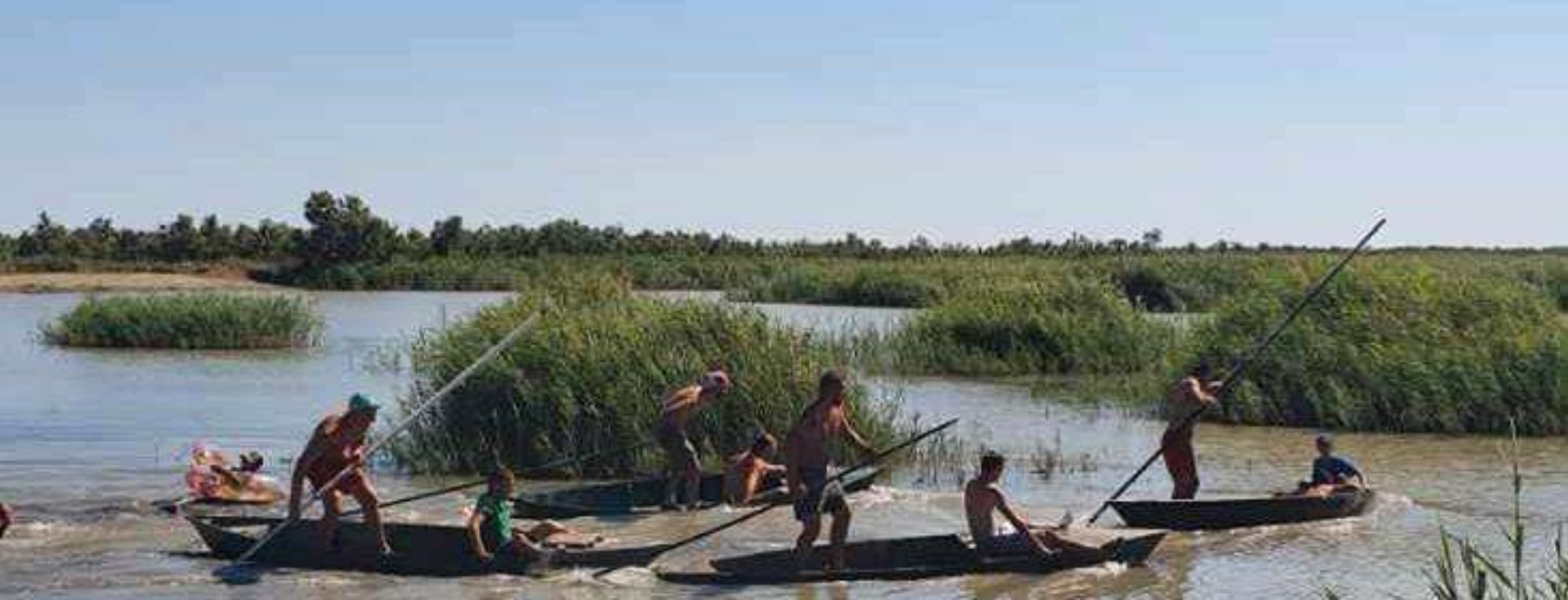
Juillet 2023: Fête du village (course à la partègue) avec le Comité des fêtes du Sambuc