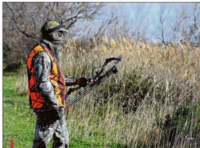
Les chasseurs membres de l'association des Archers de Camargue viendront opérer pour cette battue aux sangliers respectueuse de l'environnement.

En outre, les flèches ne peuvent parcourir qu'une quinzaine de mètres, quand une balle de fusil en parcourt une