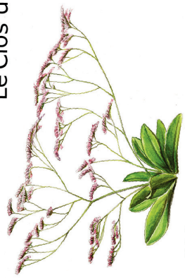
Le Clos des saladelles

Avec l'association "Les Marais du Verdier", les habitants du Sambuc gèrent cette mosaïque de zones humides camarguaises, propriété de la Tour du Valat. L'objectif : favoriser sa forte valeur écologique et développer des activités dans un esprit collectif et de concertation. Le site est en libre accès www.lesmaraisduverdier.fr